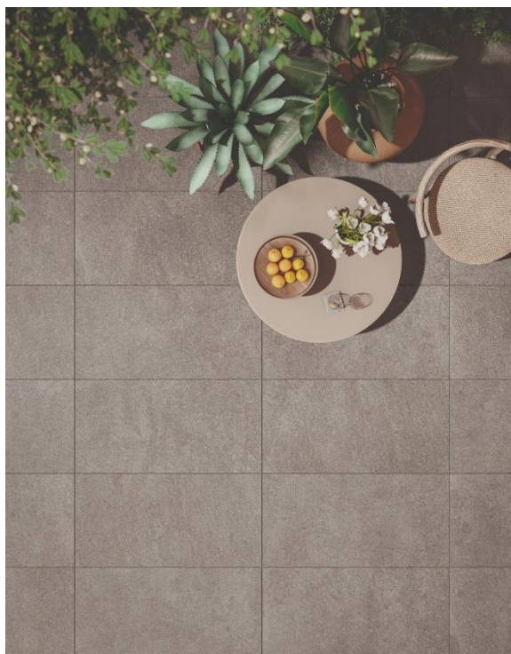
Projet Resource_Collezione ReGea